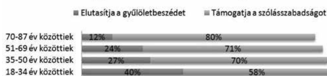
1. ábra – A gyűlöletbeszéd elutasítottsága életkor szerinti megoszlásban (PRC, 2015)